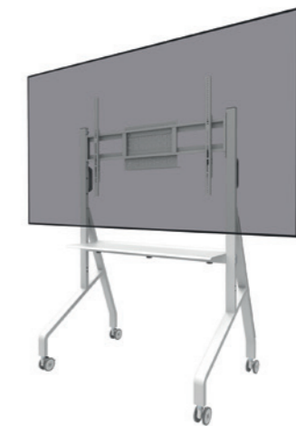
FL50-525WH1 Bildschirmgröße: 55-86" Tragfähigkeit: 76 kg Höhe: 106-136 cm