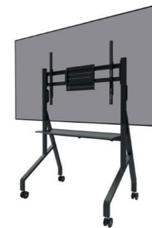
FL50-525BL1 Bildschirmgröße: 55-86" Tragfähigkeit: 76 kg Höhe: 106-136 cm